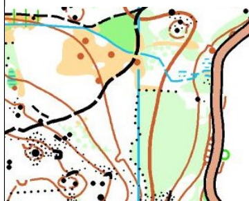
Version carto, relevés hiver 2004