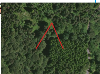
Vue aérienne 2016