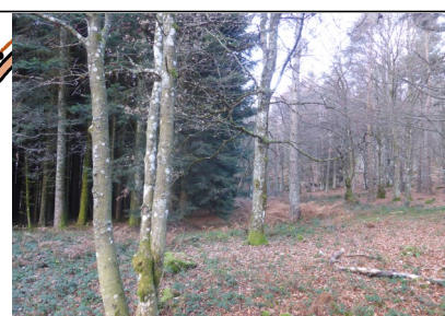
Photo octobre 2020 selon angle ci-contre